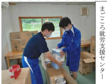
まごころ就労支援センター