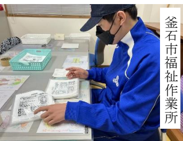
釜石市福祉作業所