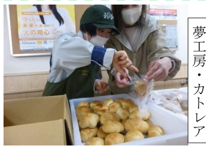
夢工房・カトレア