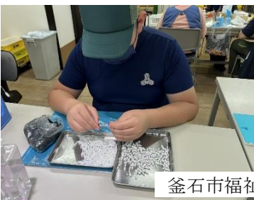
釜石市福祉作業所 2nd.